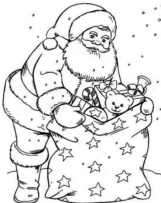
Père Noël à colorier

Résultats: dans notre prochain CyberMémo du Vendredi